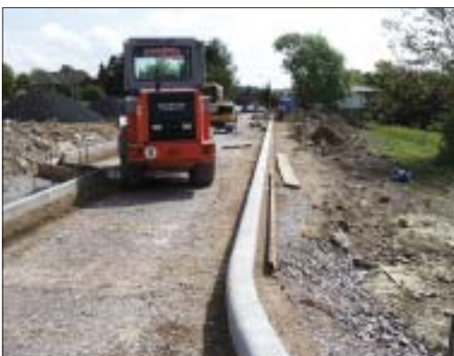
Foto: Bauarbeiten an der Flurstraße im vollen Gange