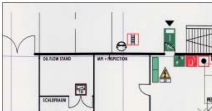
Abbildung 2: Die innere Struktur wird genauestens dokumentiert